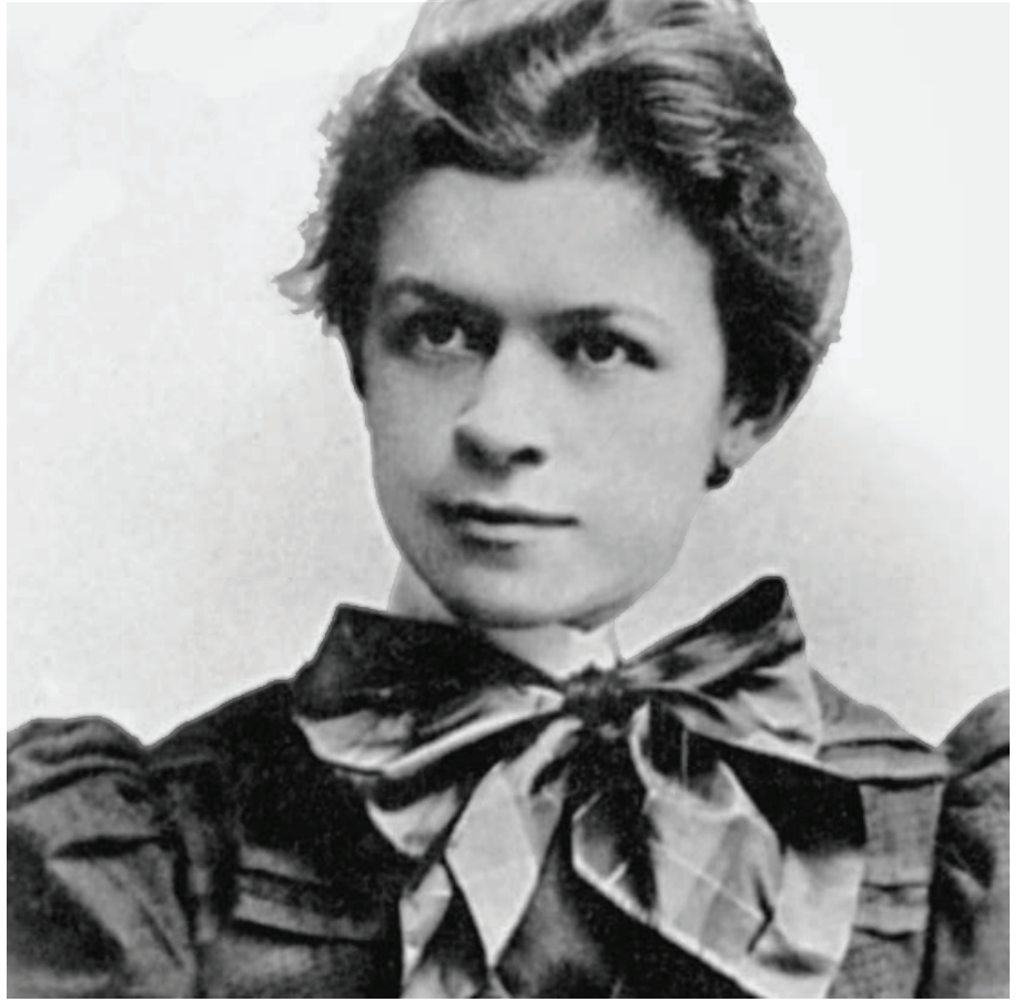
Mileva Marić, 1896.

Marić'in pansiyonuna uğramadan geçemiyordu. Marić ona piyanoda eşlik ediyor ve şarkı söylüyordu. Herkes çok güzel bir sese sahip olduğunu söylüyordu. Einstein'a karşı artan duyguları için endişelenen Marić, sonbaharda Heidelberg Üniversitesi